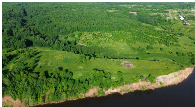
Рис. 2. Городище Анюшкар. Раскоп VI 2024 г.