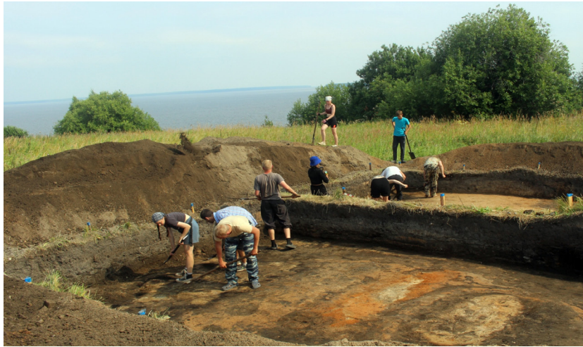
Рис. 5. Процесс работ на раскопе III 2025 г.

пах исследованы остатки сооружений преимущественно бытового характера. Но среди разнообразных находок представлены отходы, полуфабрикаты, инструментарий, связанные с кузнечным и литейным производством, сырье и полуфабрикаты для ювелирного дела (рис. 6). В особенности широко представлены предметы, связанные с косторезным производством – заготовки из рога и кости (рис. 7), не завершённые изделия. И, как и в предыдущих раскопках, среди находок многочисленны разнообразные роговые и костяные изделия, которыми так славится Анюшкар.