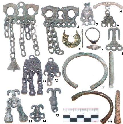
Рис. 10. Примеры бронзовых украшений: 1-10 – ломоватовской культуры, 11-15 – родановской культуры