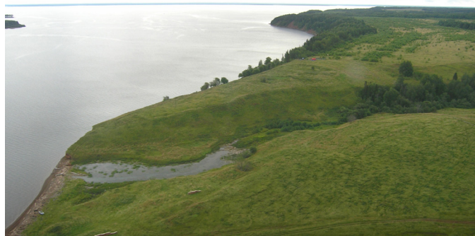
Рис. 1. Городище Анюшкар. Первое фото с воздуха, 2008 г.

До создания в 1956 г. Камского водохранилища городище Анюшкар находилось на правом берегу р. Иньвы в 6 км от ее впадения в р. Каму. Мыс высотой 12-14 м, на котором расположено городище, отделяла от берега широкая пойма. Мыс вытянут с северо-запада на юго-восток, где прослеживается высокий дугообразный вал. Общая площадь городища составляет около 16 тыс. м 2 . Сейчас городище стоит непосредственно на берегу водохранилища, воды которого большую часть года подступают вплотную к мысу и постепенно его размывают. Еще одной существенной проблемой становится то, что площадка городища зарастает деревьями. Это хорошо видно при сравнении снимка городища, сделанного в 2008 г. (рис. 1), и современных фотографий (рис. 2-3).