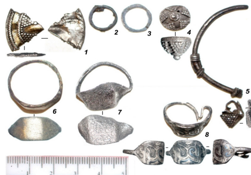
Рис. 11. Примеры украшений из серебра: 1 – фр. медальона, 2-3 – серьги, 4-5 – фр. височных украшений, 6-8 – перстни