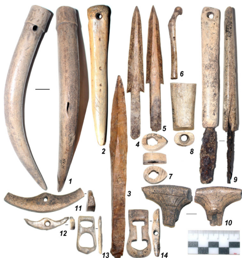
Рис. 8. Примеры изделий из кости и рога: 1 – емкость, 2 – кочедык, 3-5 – наконечники стрел, 6 – манок на рябчика, 7 – фр. наборной рукояти ножа, 8 – рукоять, 9 – железный резец с костяной рукоятью, 10 – рукоять шила, 11-14 – застежки