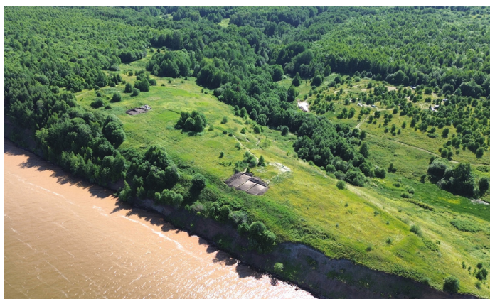
Рис. 3. Городище Анюшкар. Раскопы III и VI 2025 г.

Городище занимало выгодное стратегическое положение. Ниже Анюшкара по р. Иньве на том же берегу находилось ещё два городища – Бородинское и Усть-Иньвенское, а выше на противоположном берегу – Майкор (Туманское городище). Эти городища обеспечивали надежную защиту иньвенской территориальной группы протяженностью до 120 км, включающей около 100 археологических памятников [14, 262].