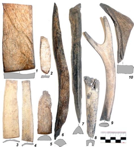
Рис. 7. Заготовки из кости и рога

сти жителей городища. Самой сложной задачей является сбор разрозненных и частично уже утраченных материалов предыдущих исследований, их обобщение и подготовка масштабной публикации, которой памятник, безусловно, заслуживает.