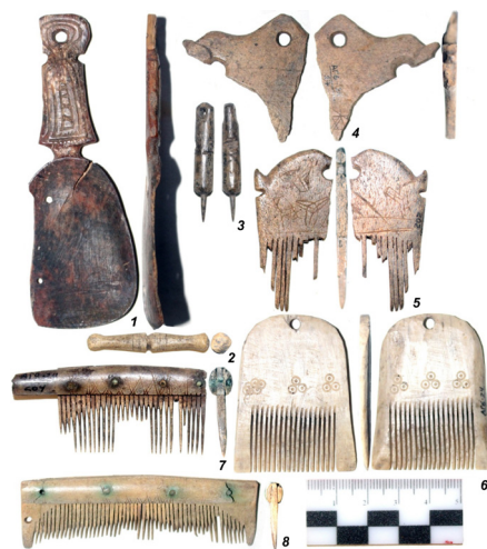
Рис. 9. Примеры изделий из кости и рога: 1 – ложка, 2 – пуговица, 3 – ногтечистка, 4-6 – гребешки, 7-8 – наборные расчески