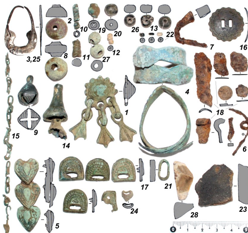
Рис. 3. Инвентарь ямы 12/20 (номера предметов по плану, рис. 1): 1 – бронзовая шумящая умбоновидная подвеска; 2, 8, 19, 27 – бусы бронзовые; 3, 25 – фрагменты серебряной височной подвески; 4 – браслет бронзовый; 5, 17, 21, 24 – накладки поясные бронзовые; 6 – проволока железная; 7 – гвоздь подковный железный; 9 – бубенчик бронзовый; 10 – пронизка спиралевидная бронзовая; 11 – фр. бронзовой привески-колокольчика; 12, 13, 20, 22, 26 – бусы и бисер стеклянные; 14 – бронзовая пронизка-колокольчик с кожаным шнурком и бронзовым бубенчиком внутри; 15 – фрагменты бронзовой цепочки; 16 – бронзовая бляха-пуговица от конской сбруи; 18 – железные предметы; 23 – фрагмент деревянной керамики; 28 – кресальный кремь

умбоновидная подвеска (рис. 3: 1); бронзовый браслет (рис. 3: 4); 10 бронзовых поясных накладок (рис. 3: 5, 17, 21, 24); кресальный кремь (рис. 3: 28). Представленный комплекс достаточно типичен для Рождественского могильника.