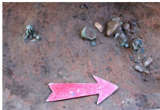
Рис. 2. Содержимое ямы 12/20 после расчистки. Вид с востока

Слои на профиле: 2 – плотный пестроцветный серо-коричневый суглинок – деревенский культурный слой; 3 – плотный бурый суглинок; 5 – материк – красная глина; 12 – светлый крупнозернистый песок (находки см. рис.3)