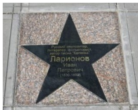
Звезда на Аллее Славы