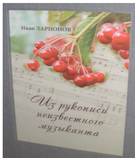
«Из рукописи неизвестного музыканта»