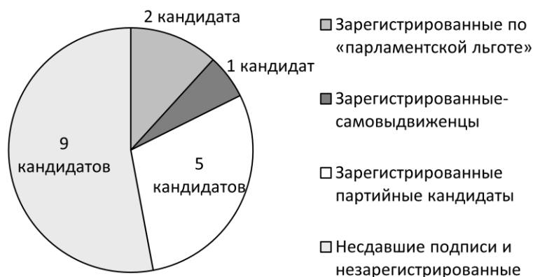
Рис. 3. Состав кандидатов на этапе регистрации

что в одном регионе можно собрать не более 2 500 подписей, необходимо создать избирательные штабы в не менее чем в 42–43 регионах страны. Для качественного и оперативного сбора подписей желательно в каждом региональном штабе иметь порядка 30–40 платных сборщиков, организационную группу, а еще нужны юристы, нотариусы, помещение, транспорт, офисная техника, агитационные материалы, канцтовары, печать и доставка подписных листов. Поэтому представляется сомнительным, что ряд кандидатов (например, Антон Баков («Монархическая партия»), Ирина Волынец («Народная партия России»), Михаил Козлов («Партия Социальной Защиты»), Роман Худяков («ЧЕСТНО»), которые израсходовали менее 100 тыс. руб.), действительно пытались осуществить сбор подписей и намеревались принять реальное участие в выборах. Расходы более 2 млн руб., по-видимому, могут свидетельствовать о серьезности изначальных намерений кандидатов: самовыдвиженцы В. Путин и В. Михайлов, выдвиженцы от партий – С. Бабурин, Е. Гордон, К. Собчак, Г. Явлинский, Б. Титов. Выдвиженцы ряда партий малых партий «второго эшелона» попытались опереться на имеющиеся кадровые ресурсы партий. Из них, судя по всему, справиться с задачей удалось только М. Сурайкину («Комму-