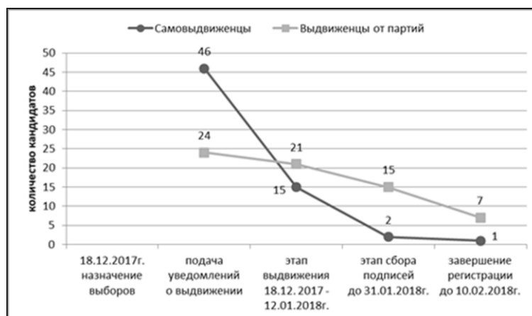
Рис. 4. Динамика количества кандидатов на выборах Президента РФ 2018 г.

(М. Сурайкин), до «традиционалистов-государственников» и «национально-патриотических» сил (С. Бабурин, В. Жириновский, П. Грудинин); были представлены как представители умеренно-правых взглядов (Б. Титов), так и либеральных оппозиционных сил (К. Собчак, Г. Явлинский). Однако после этапа регистрации кампания приобрела ярко выраженный неконкурентный характер в силу безусловного преимущества действующего президента Владимира Путина над всеми остальными кандидатами.