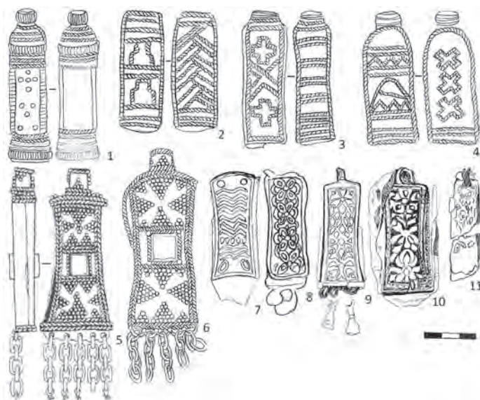
Рис. 3. Флаконовидные пронизки с территории

Технику изготовления флаконовидных пронизок с филигранным и зерновым декором достаточно полно можно реконструировать по изделию, происходящему из Лекмартовского клада (рис. 4). Первоначально при помощи литья была изготовлена основа пронизки, повторяющая форму изделия – пустотелого приплюснутого флакона в виде вытянутой трапеции. К одной из сторон основы были прилиты петельки из проволочки для последующего подвешивания шумящих элементов (рис. 4, 1В). Основа подвески покрывалась тонким серебряным листом. К центральной части изделия с двух сторон припаивались квадратные касты для каменной или стеклянной вставки, изготовленные из согнутой полоски прямоугольной формы, вырезанной из тонкого серебряного листа (рис. 4, 1Б). Изделие декорировалось с помощью зерни и торсированной проволочки (проволочки прямоугольного сечения, крученной вокруг своей оси) (рис. 4, 1А, 1Б, 1Г). Торсированную проволочку укладывали и припаивали на изделие двумя рядами