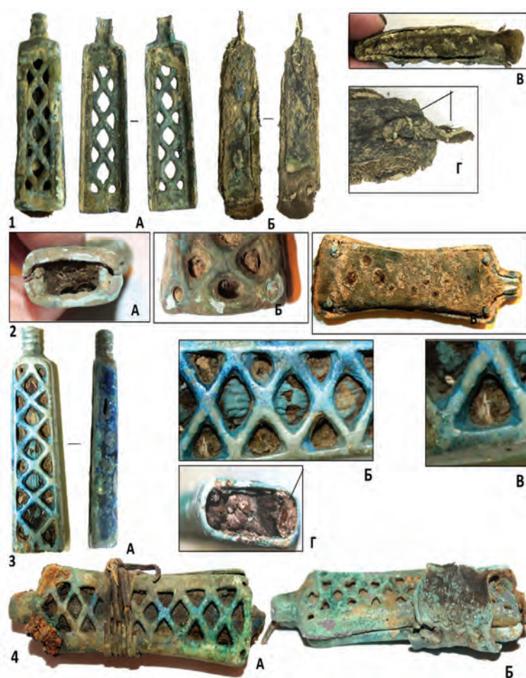
Рис. 2. Особенности изготовления основы флаконовидных подвесок первой подгруппы на примере изделий из Баяновского могильника.

При втором способе основа изделий была цельнолитой (рис.2, 3). Она была