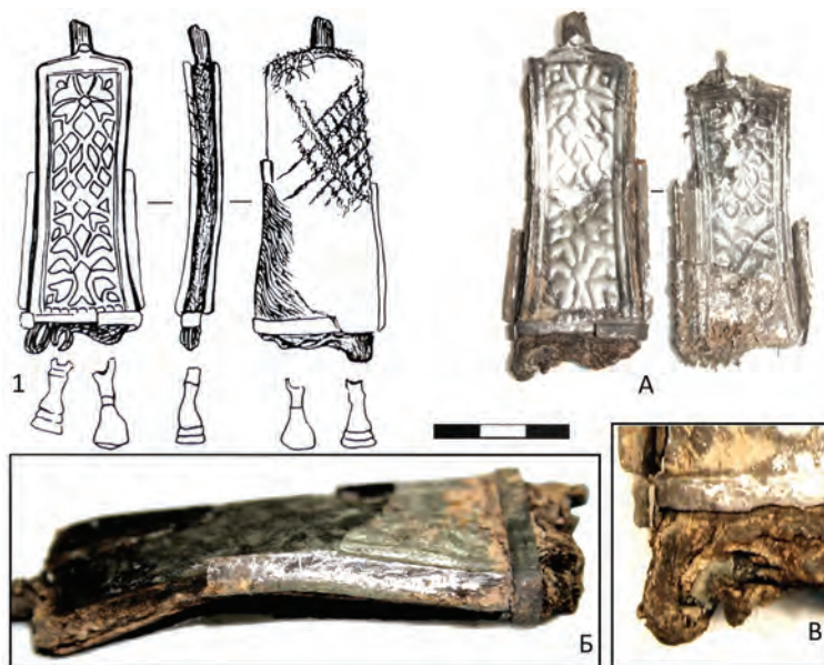
Рис. 5. Флаконовидные подвески с тиснеными пластинами (на примере изделия из погребения 333 Баяновского могильника). 1. Реконструкция общего вида изделия: А – серебряные детали изделия, Б – фиксация спрессованного войлока с кожей и с фрагментом серебряной пластины-обкладки, В – фиксация отверстия в припуске войлочной основы для привешивания шумящих элементов

предшествующего типа. Одно из изделий происходит из Лёкмартовского клада, достаточно обоснованно датированного исследователями X–XI вв. [7, с.139]. Приемы и техники, применяемые при их изготовлении, были характерны для прикамского ювелирного центра (-ов) достаточно продолжительный период времени – X–XIV вв. [13, с. 1–8], но пик их распространения и развития приходится именно на X–XI вв. Малое количество таких изделий может свидетельствовать и о коротком периоде их распространения.