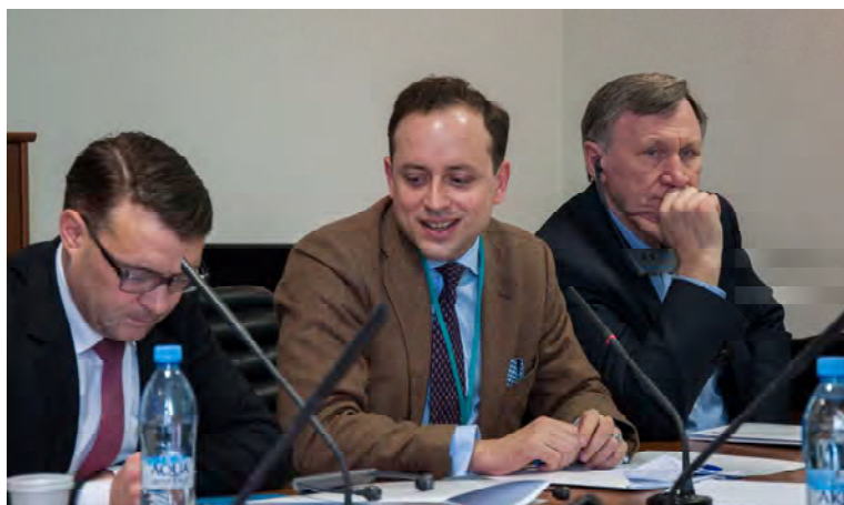
Слева направо: Патрик Курт, Юлиус фон Фрайтаг-Лорингховен, Валерий Павлович Матвеев

Депутат Бундестага ФРГ в 2009–2013 гг. от Свободной демократической партии Германии (СвДП) Патрик Курт среди наиболее значимых причин ослабления роли либералов в политике ЕС и ФРГ назвал неоднозначно воспринятые населением и элитами мероприятия федерального правительства в 2009–2013 гг. по преодолению кризиса и помощи странам-банкротам ЕС, а также их позиции в отношении событий на Украине. В результате, на последних выборах в Германии значительная часть либерального электората ушла к различного рода популистским и протестным партиям. Доля избирателей, идентифицирующих себя с СвДП, в преддверии европейских выборов достигла критической отметки в 3 %.