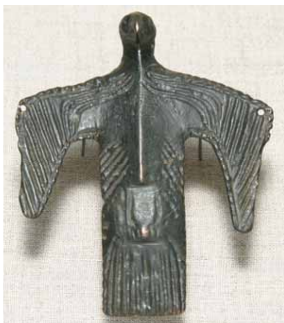
«Птица-душа», бронза, X–XII вв., бив. Пермская губерния, ПКМ

лей, следует относить исключительно культовые ажурные или сплошные односторонние литые бронзово-медные сюжетные пластины-плакетки, входившие в определенные системные наборы. Именно они имели идеологическое значение и являются отражением древних верований. Помимо культовых плакеток, к зве-