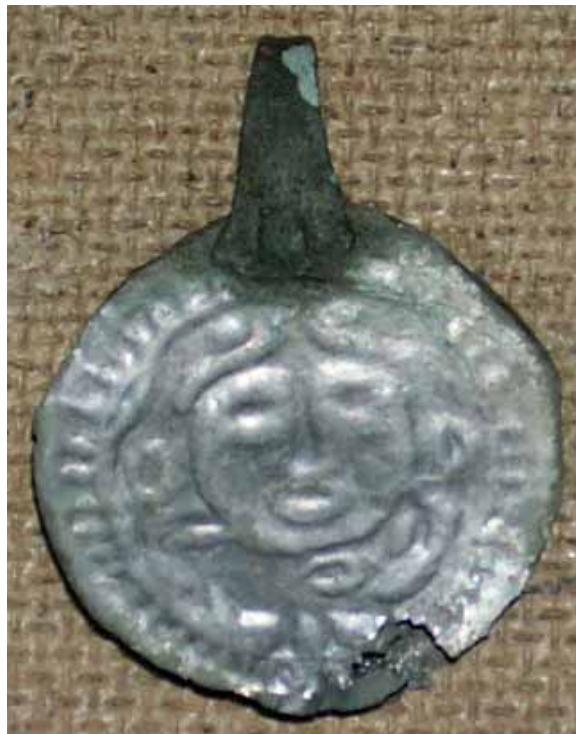
Личина в окружении человеко-лосей, серебро и бронза, VIII–IX вв., Запосельское поселение, МАЭ ПГПУ

2-й период – 1950-е годы – до современного момента – период активного интереса к исследованию пермского звериного стиля, для которого было свойственно восстановление некой преемственности с предыдущим этапом изучения и вместе с тем постановка новых задач в отношении культового литья. Для этого периода характерно появление научных исследовательских школ, в рамках которых ведется исследование пермского звериного стиля, складывается терминологический аппарат, «язык», которым описывается круг изучаемых явлений. Основной упор уже делается не на внешние атрибутивные признаки культового литья, а на извлечение смысла, внутреннего содержания как отдельных сюжетов и обра-