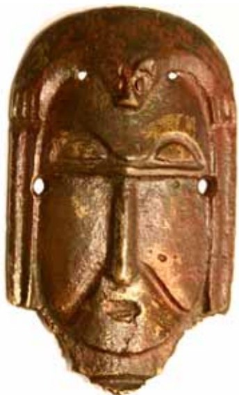
Фрагмент антропоморфного идола («Золотая баба»), бронза, XI–XII вв., Городищенское городище, МАЭ ПГПУ

зов пермского звериного стиля, так и всего комплекса. При этом, несмотря на имеющиеся отличия в трактовке семантики, представляется возможным рассматривать теории и гипотезы, связанные с изучением пермского звериного стиля, в