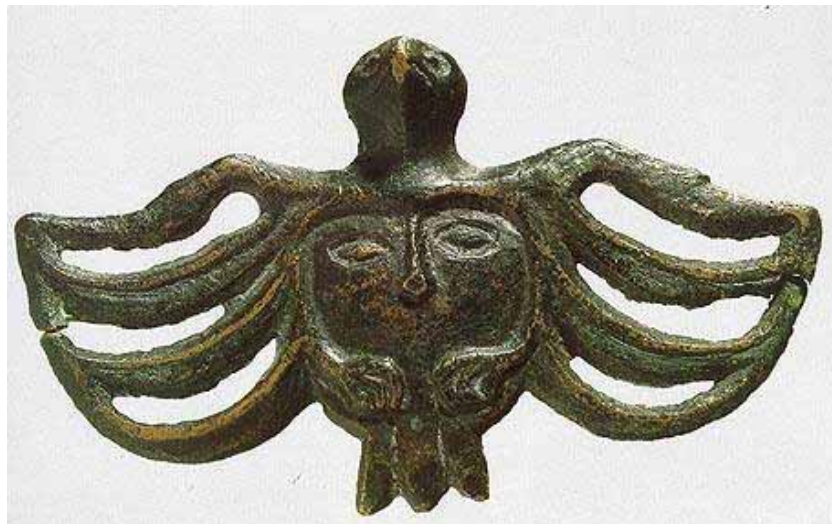
«Птица-душа», бронза, IX–XI вв., бив. Соликамский уезд, ГЭ

Три указанных стиля (печерский, пермский, западносибирский) имеют ряд