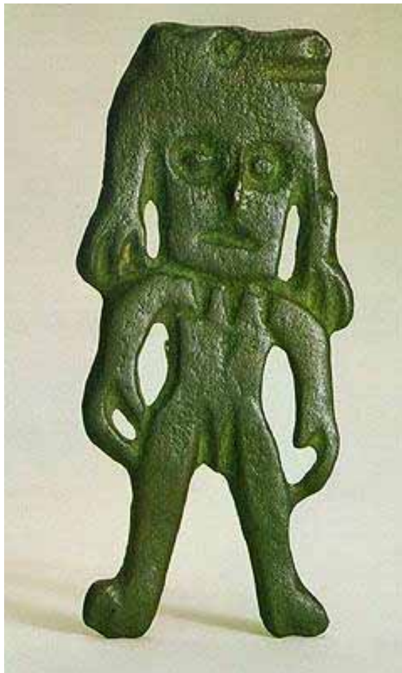
Антропоморфное существо («перевертыш»), бронза, I–III вв., Гавевское костыше.