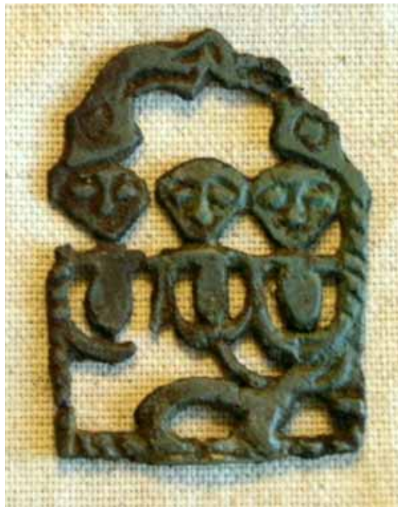
«Святое семейство», бронза, IX–X вв., быв. Чердынский уезд, ЧКМ

территориальными стереотипами. В печорском художественно-прикладном стиле практически отсутствует мотив медведя, наиболее ярко выраженный в западносибирском стиле, и сюжеты типа «святое семейство», наиболее представленные в пермском стиле. Пермский стиль, таким образом, может рассматриваться как переходный, что совпадает, до определенной степени, с географическим положением территории распространения изделий пермского звериного стиля.