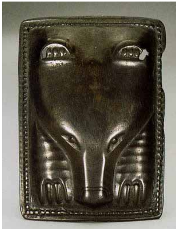
Нагрудная бляха с изображением медведя в жертвенной позе, бронза, VI–VIII вв., с. Кьин, ГЭ