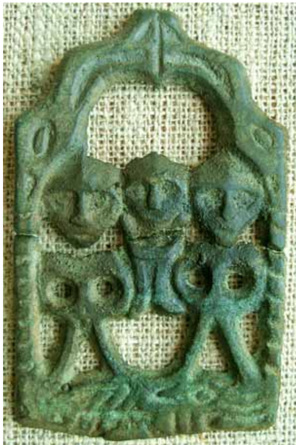
«Святое семейство», бронза, VIII–X вв., быв. Чердынский уезд, ЧКМ

том и назначением предмета. Это свидетельствует о выработке строгой иерархии и законченности структур в социальной и идеологической сферах в древнем уралосибирском обществе 1-го тысячелетия н.э. Системность культовых плакеток зве-