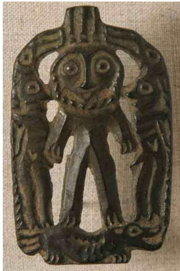
«Перевертыш» в окружении сульде, бронза, VI–VIII вв., быв. Пермская губерния, ПКМ

языка искусства пермского звериного стиля весьма развитая, ибо звериный стиль берет свое начало в палеолите.