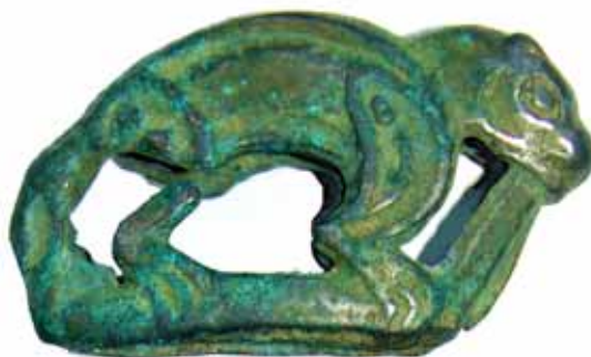
Навершие кинжала, бронза, X–XI вв., Рождественский могильник, МАЭ ПГПУ