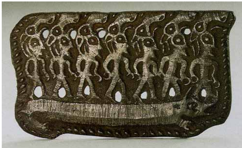
Семь человеко-лосей на ящере, бронза, VII–VIII вв., быв. Пермская губерния, ГЭ

Тем самым, рассматривая историю изучения пермского звериного стиля как