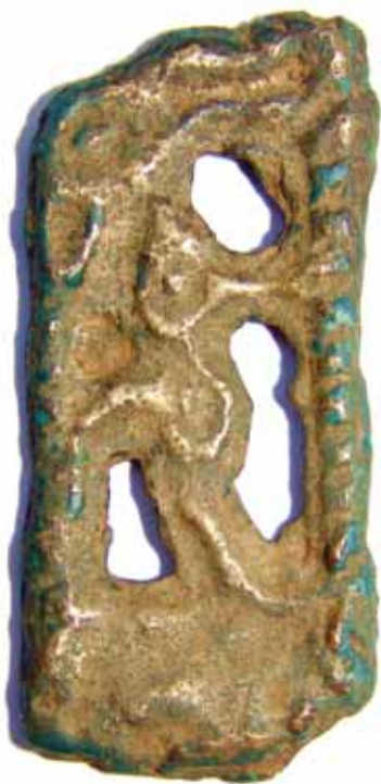
Человеко-лось (сульде), бронза, VIII–IX вв., Запосельское поселение, МАЭ ПГПУ

ты пермского звериного стиля из коллекции графа С.Г. Строганова, в Государственном Историческом музее – из собрания П.И. Щукина, в основе коллекции культового литья Пермского краевого музея находится собрание А.Е. и Ф.А. Теп-