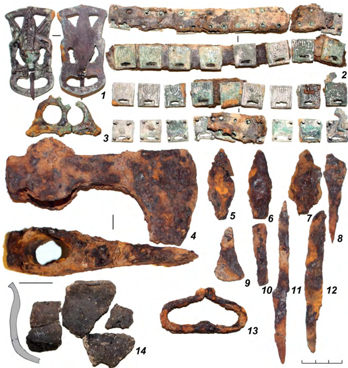
Рис. 2. Инвентарь погребения № 325 Рождественского могильника: 1 – пряжка бронзовая, 2 – фрагменты кожаного ремня с серебряными накладками, 3 – фрагменты кресала с бронзовой рукоятью, 4 – топор железный, 5-8 – фрагменты железных наконечников стрел, 9-10 – фрагменты железных инструментов, 11-12 – ножи железные, 13 – кресало железное, 14 – фрагменты керамического сосуда

они продолжали сохраняться в арсенале вооружения, но в погребения их уже не помещали; по мнению исследователя, сабли нельзя отнести к значимому и распространенному в Пермском Предуралье виду вооружения, они скорее служили знаком высокого социального статуса владельца [6, с. 103–104].