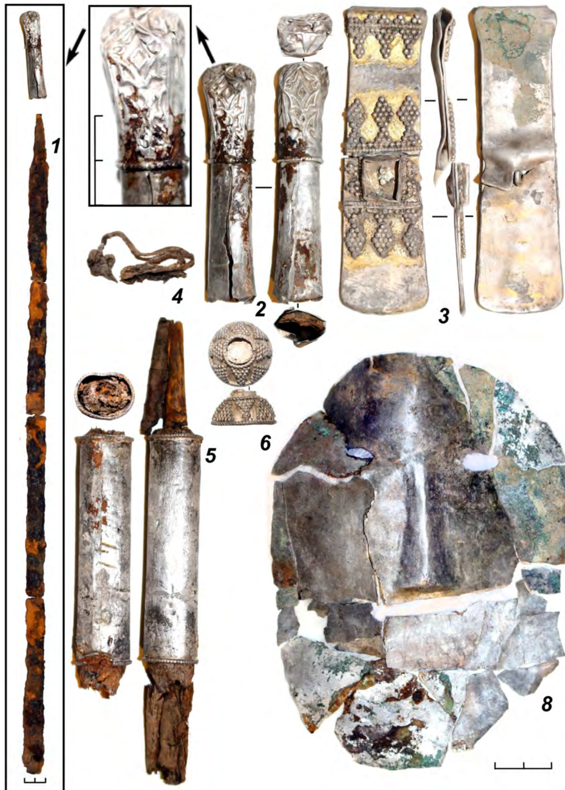
Рис. 3. Инвентарь погребения № 325 Рождественского могильника: 1 – фрагменты железной сабли, 2 – серебряное навершие деревянной рукояти сабли, 3 – трапецевидная серебряная подвеска с позолотой, 4 – кожаный шнурок, которым были перевязаны предметы, завернутые в маску, 5 – фрагмент плетки с серебряной рукоятью, 6 – серебряный «колпачок», 7 – серебряная погребальная маска