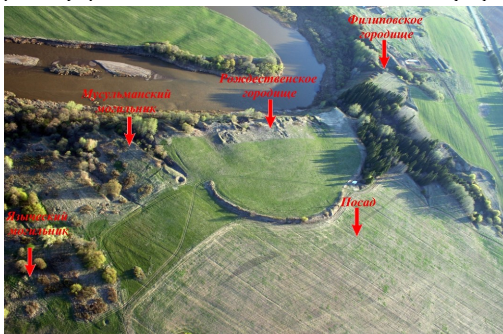
Рис. 2. Рождественский археологический комплекс

Наиболее важным и интересным открытием стала медницкая мастерская – единственная известная на настоящее время на археологических объектах средневекового времени в Волго-Камском регионе [26; 27; 34]. Мастерская располагалась в большом доме площадью 216 м 2 , построенном в каркасно-столбовой технике, как и жилища, изученные на городище. Не исключено, что мастер с семьей жил здесь же в помещении, отделенном перегородкой.