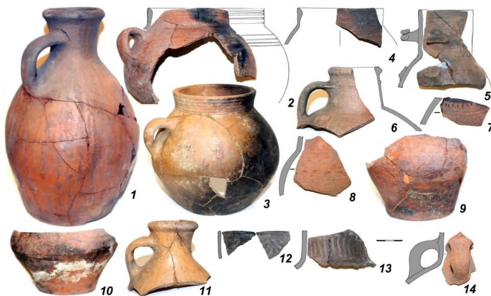
Рис. 3. Булгарская керамика Рождественского городища

пользованием оригинального аппаратурно-методического комплекса, основанного на последовательном применении площадного электропрофилирования и электротомографии (автор-разработчик д-р ист. наук И.В. Журбин – Физико-технический институт УдмФИЦ УрО РАН). Как показала апробация комплексной методики, геофизика (метод электроразведки) позволяет оперативно получить информацию о планировке памятника и структуре его культурного слоя. Опыт показал эффективность комплексных электрометрических исследований при определении границ заглубленных объектов и участков с большей мощностью культурного слоя.