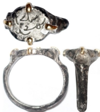
Рис. 4. Перстень-печатка, Рождественское городище. Серебро, золото

Уникальной находкой для Предуралья стал найденный в мастерской в 2021 г. именной перстень-печатка, изготовленный из серебра и золота, на котором почерком Насх, характерным для XIII–XIV вв., вырезано имя – Аджлаб ибн ‘Умар. Таким образом, нам стало известно имя одного из жителей Пермского края XIII века (рис. 4). На Рождественском городище впервые в Пермском крае произведены исследования с ис-