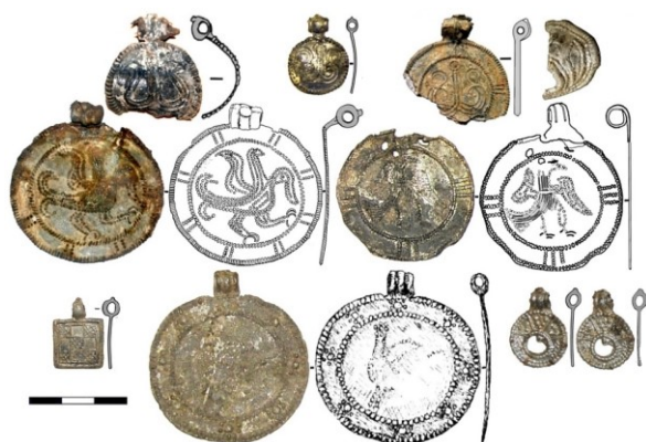
Рис. 6. Украшения из оловянистого сплава Плотниковского могильника

В 2007 г. на могильнике было обнаружено погребение ребенка с огнестрельным (картечным) ранением головы. Это первое свидетельство столь раннего использования огнестрельного оружия на территории Пермского края. Употребление огнестрельного оружия в русских землях Северо-запада и Верхне-Волжья началось не позднее середины XIV в., а к концу столетия стало достаточно привычным для ратных людей [6]. Ребенок, вероятно всего, пал жертвой либо нападения ушкуйников, либо случайного выстрела при испытании нового и непривычного оружия пермским ратником, завербованным в отряд. И как не фантастична вторая трактовка, она ка-