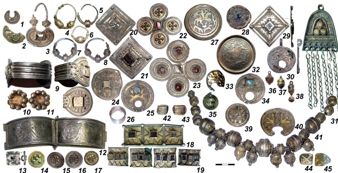
Рис. 7. Ассортимент ювелирных изделий XII-XIV вв.: 1-8 – височные украшения; 9, 12, 18-19 – браслеты, 13-17 – поясные накладки; 10-11, 20-24, 27-29, 32, 35, 39 – медальоны; 25, 30, 33-34, 40 – лунницы; 31 – арочная подвеска, 36-38, 41 – бусы, привески-бубенчики; 26, 42-45 – перстни. 1, 3, 7-8, 15-16; 18-19, 26, 36, 39-41 – Пермский край; 2 – Антыбарский могильник; 4, 6, 42-45 – Плотниковский могильник; 5 – Рачевское городище; 9 – Чурино; 10-11, 27, 34 – Чердынь; 12 – Кудымкарское городище; 13, 28-30, 38 – Рождественское городище; 14, 32-33, 37 – могильник Телячий Брод; 17 – Саломатовское городище; 20-25 – Вильгортский клад; 31 – Пыскарский клад; 35 – коллекция Теплоуховых. Материал: 14,30 – бронза, остальное – серебро, позолота, чернь

В настоящее время сотрудниками отдела выполняется грант РФФИ 20-49-590001-ра «Средневековое ювелирное наследие Пермского края: стилистические и химико-технологические особенности» (рук. ст. науч. сотр. Ю.А. Подосёнова), направленный на комплексное исследование ювелирных изделий, изготовленных на территории Пермского Предуралья в эпоху средневековья. Эти изделия являются не только частью средневекового историко-культурного насле-