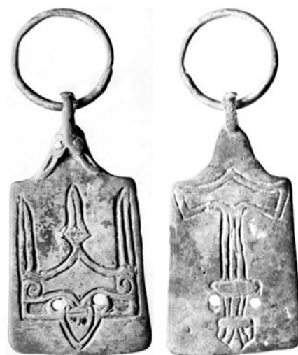
Рис. 8. Подвеска с тамгой Владимира I Святославовича и Олафа Трюгвассона. Погребение № 37 Рождественский могильник

англосаксонского пенни с титулом и именем Этельреда II Неблагоразумного, чеканенного в г. Вилтон между 1009–1017 гг. Источником таких монет поступления являлись Новгородские земли . В комплексах XI в. присутствуют отдельные экземпляры спиральновитых и разомкнутых пластинчатых широкосрединных перстней, подковообразных фибул . Обнаружены фрагмент нательного креста «скандинавского» типа XI–XIII вв., калачевидная височная подвеска с характерным для северо-западной Руси чеканным орнаментом. К более массовому материалу можно отнести бусы древнерусского производства , приток которых наблюдается с начала XI века. Самой уникальной находкой, безусловно, является серебряная трапецевидная подвеска из погр. №37, на лицевой стороне которой – парадное изображение трезубца Владимира I Святославовича, на оборотной – знак в виде соединения молота Тора и меча, соответствующего реальным прототипам X века, возможно, это тамга Олафа Трюгвассона, сопровителя Владимира в Старой Ладогге. Подвеска с Рождественского могильника была истолкована как верительный знак , дававший право купцу из Предуралья торговать как на территории древнерусского государства, так и в скандинавских землях (рис. 8).